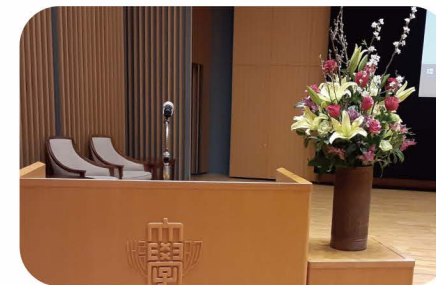
演台花（アカデミーホール仕様） 単価30,000円（税込33,000円）