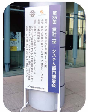
（アカデミーコモン1階外に設置）