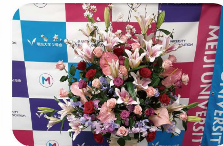
自立式大型花（ギリシア柱） 単価50,000円（税込55,000円）